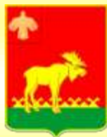
Герб Троицко – Печорского района

— Что же изображено на гербе РК? ( Птица, человек, лось )